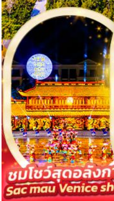
ชมโชว์สุดอลังการ Sac mau Venice show