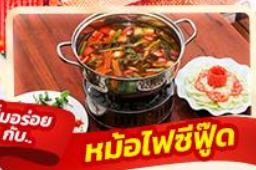
อิ่มอร่อย กับ... หม้อไฟซีฟู้ด