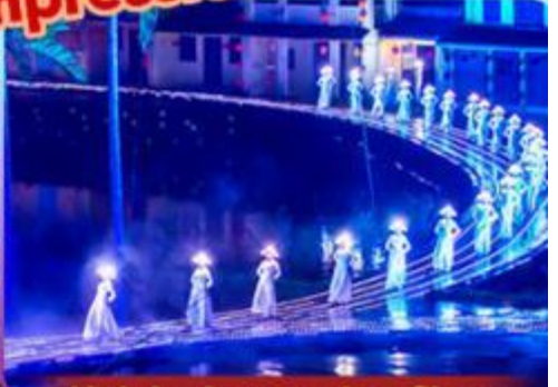
Hoi An Impression Show