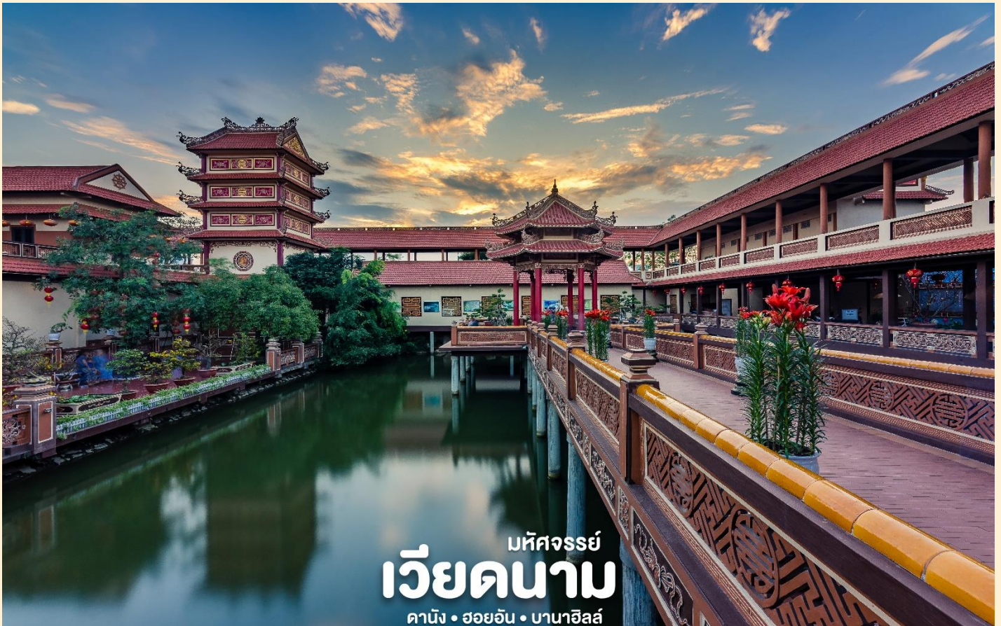
มัทศจรรย์ เวียดนาม ดานัง • ฮอยอัน • บานาฮิลล์

Tel: 085-4063944 letagotravel@gmail.com Line ID: @letagotravel https://www.letago.com