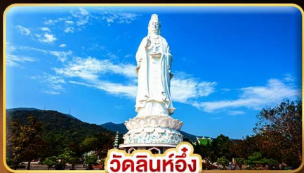
วัดลินห์อึ้ง