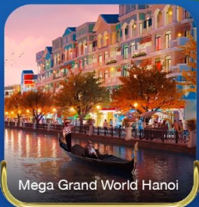
Mega Grand World Hanoi