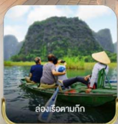
ล่องเรือตามกัก