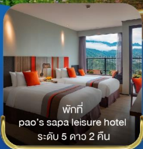
พักที่ pao's sapa leisure hotel ระดับ 5 ดาว 2 คืน