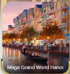
Mega Grand World Hanoi