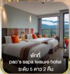
พักที่ paos sapa leisure hotel ระดับ 5 ดาว 2 คืน