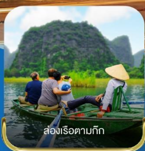
ล่องเรือตามก๊ิก