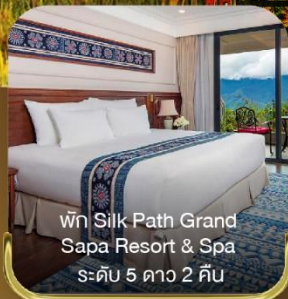
พัก Silk Path Grand Sapa Resort & Spa ระดับ 5 ดาว 2 คืน