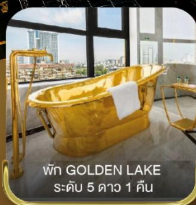
พัก GOLDEN LAKE ระดับ 5 ดาว 1 คืน