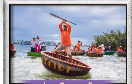
ล่องเรือกระดิ่ง