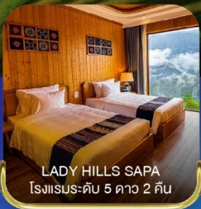
LADY HILLS SAPA โรงแรมระดับ 5 ดาว 2 คืน