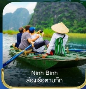
Ninh Binh ล่องเรือตามกีก