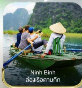
Ninh Binh ล่องเรือตามทิว