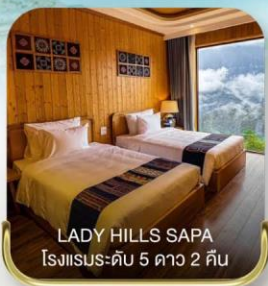
LADY HILLS SAPA โรงแรมระดับ 5 ดาว 2 คืน