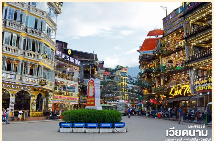
เวียดนาม ฮานอย • ซาปา • ฟานซิปัน • ดงพญาไฟ

นำท่าน ชมโบสถ์หินซาปา ที่สร้างขึ้น โดยชาวฝรั่งเศส แต่เดิมมีชาวฝรั่งเศส จำนวนมากอาศัยอยู่ในเมืองนี้ ทำให้มีการสร้างโบสถ์นี้ขึ้นเพื่อให้ชาวฝรั่งเศส เข้าร่วมพิธีมิสซาในวัดหยุด แต่ในปัจจุบันได้มีการอนุรักษ์โบสถ์แห่งนี้ไว้เป็นที่รำลึกและยังเป็นสถานที่ท่องเที่ยว อีกแห่งหนึ่งที่มีความสวยงามเป็นอย่างมาก ในเมืองซาปา และอิสระท่าน ช้อปปิ้งในซามาเก็ต ให้ท่านได้เลือกซื้อของที่ระลึกและของฝาก ต่างๆมากมายตามอัธยาศัย