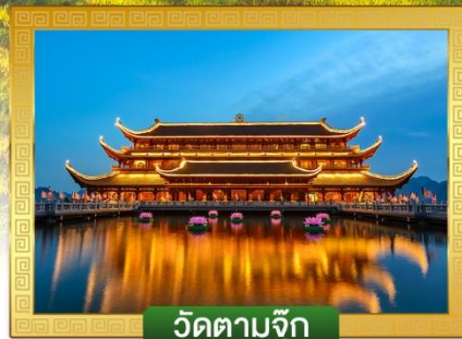
วัดตามจ๊ก