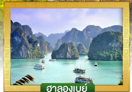
ฮาลองเบย์