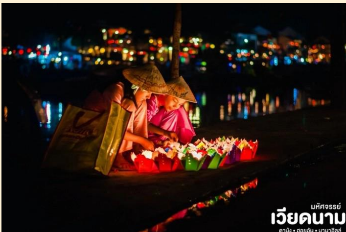
เวียดนาม

นำท่าน ล่องเรือลอยกระทง ในแม่น้ำห้วย และเพลิดเพลินไปกับทิวทัศน์ของเมืองโบราณฮอยอันในยามค่ำ ค่ำคืนที่ส่องแสงระยิบระยับด้วยแสงไฟ