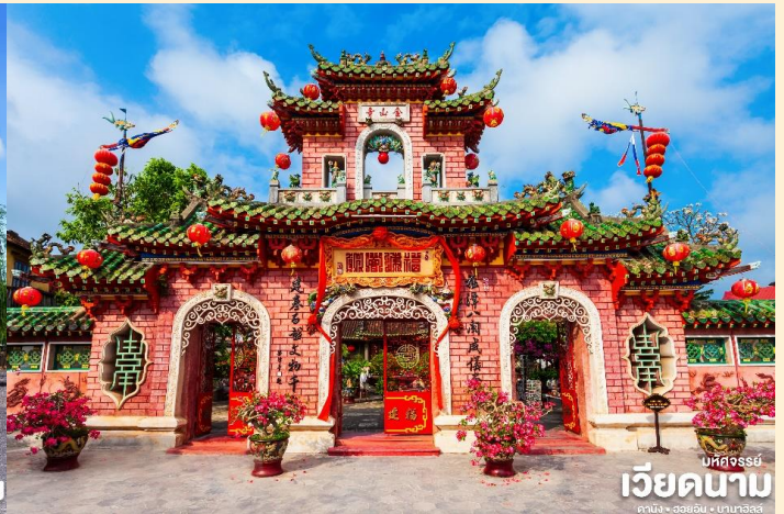
เวียดนาม

นำท่าน ล่องเรือลอยกระทง ในแม่น้ำห้วย และเพลิดเพลินไปกับทิวทัศน์ของเมืองโบราณฮอยอันในยามค่ำ ค่ำคืนที่ส่องแสงระยิบระยับด้วยแสงไฟ