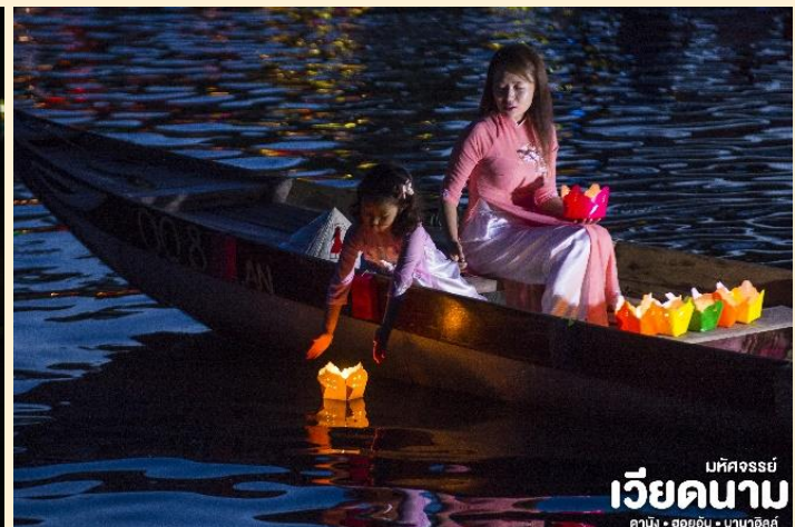
เวียดนาม

เย็น บริการอาหารเย็น ณ ร้านอาหาร ที่พัก เข้าสู่ที่พัก MAGNOLIA HOTEL 4* หรือเทียบเท่ามาตรฐานเวียดนาม (โรงแรมที่ระบุในรายการทัวร์เป็นเพียงโรงแรมที่นำเสนอเบื้องต้นเท่านั้น ซึ่งอาจมีการเปลี่ยนแปลงแต่โรงแรมที่เข้าพักจะเป็นโรงแรมระดับเทียบเท่ากัน)