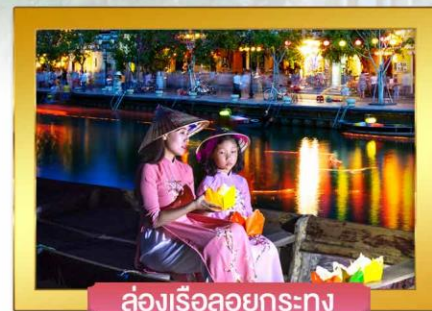
ล่องเรือลอยกระทง