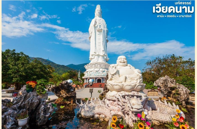
มัทฉะจรรยา เวียดนาม ดานัง • ฮอยอัน • บานาฮิลล์

เป็นวัดที่ใหญ่ที่สุดของเมืองดานังภายในวิหารใหญ่ของวัดเป็นสถานที่บูชาเจ้าแม่กวนอิมและเทพองค์ต่างๆตามความเชื่อของชาวบ้านแถบนี้นอกจากนี้ยังมีรูปปั้นปูนขาวเจ้าแม่กวนอิมซึ่งมีความสูงถึง 67 เมตรตั้งอยู่บนฐานดอกบัวกว้าง 35