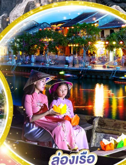
ล่องเรือ ลอยกระทง