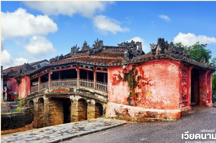
เวียดนาม

อินเดียและทางอยู่ที่ญี่ปุ่น ส่วนลำตัวอยู่ที่เวียดนาม เมื่อใดที่มังกรพลิกตัวจะเกิดน้ำท่วมหรือแผ่นดินไหว ชาวญี่ปุ่นจึงสร้างสะพานนี้โดยตอกเสาเข็มลงกลางลำตัวเพื่อจำกัดมันจะได้ไม่เกิดภัยพิบัติขึ้นอีก ชม ศาลกวนอู ซึ่งอยู่บนสะพาน ญี่ปุ่นและที่ฮอยอันชาวบ้านจะนำสินค้าต่าง ๆ ไว้ที่หน้าบ้าน เพื่อขายให้แก่นักท่องเที่ยวท่านสามารถซื้อของที่ระลึก เป็นของฝากกลับบ้านได้อีกด้วย เช่น กระเป๋าโคมไฟ เป็นต้น