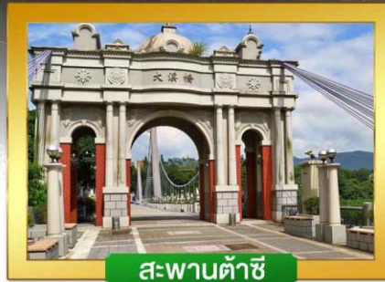
สะพานต้าซี