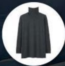
Heattech (ฮีทเทค) ระบบนาฬิกา กึ่งกางเกงและเสื้อ

1. เสื้อผ้าควรเตรียมเสื้อผ้าสำหรับป้องกันความหนาวใช้ในอุณหภูมิต่ำสุด -40 องศาโดยประมาณ