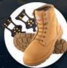
รองเท้าสำหรับเดินบนหิมะ น้ำแข็ง หรือติดกับหิน Ice grippers