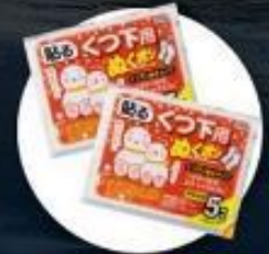
แผ่นความร้อนสำหรับ ให้ความอบอุ่นร่างกาย