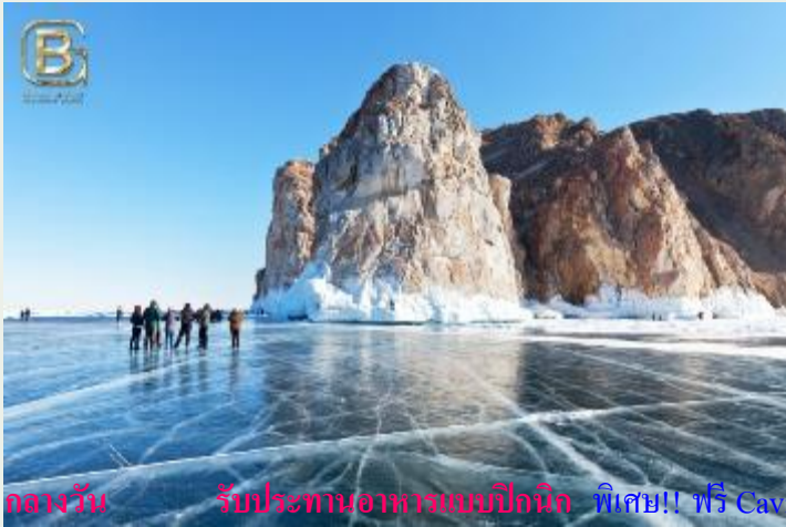
กลางวัน รับประทานอาหารแบบปิกนิก พิเศษ!! ฟรี Caviar & Champagne (คาเวียร์แดง + แชมเปญ 1 ชุด/ท่าน)