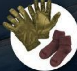
ถุงมือหนาขุ่น ถุงเท้ากันหนาวแบบหนา