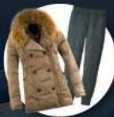
เสื้อและกางเกง กันหนาว, กันลม