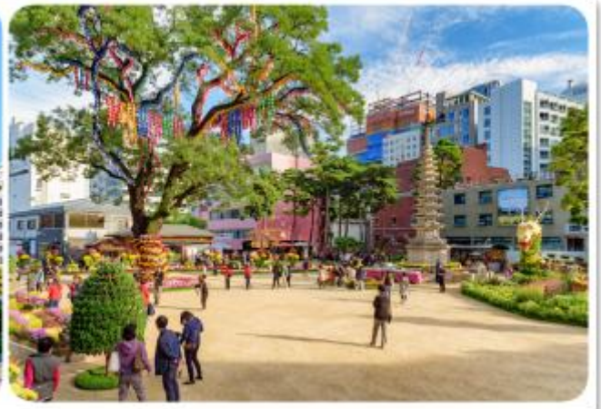
ตามใจชอบ

วัดโซเกซา แห่งนี้สร้างขึ้นในสมัยศตวรรษที่ 14 ช่วงสมัยโครยอ วัดแห่งนี้ถือเป็นศูนย์กลางของพุทธศาสนานิกายโซเก ที่มีรากฐานมาตั้งแต่ช่วงศตวรรษที่ 9 วัดแห่งนี้ถึงแม้จะเป็นวัดที่ตั้งอยู่ท่ามกลางความวุ่นวายของเมืองแต่ภายในวัดมีความเงียบสงบและสวยงามด้วยศิลปะ สถาปัตยกรรม วัดนี้จึงเป็นวัดที่มีชื่อเสียงของประเทศเกาหลีภายในวัดมีต้นไม้ใหญ่ที่มีความสูงกว่า 26 เมตร อาคารเก่าแก่ และเจดีย์ที่แกะสลักจากหินสูง 7 ชั้น