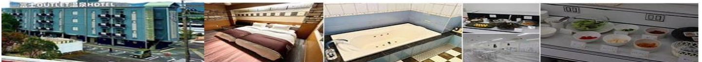
FUJI OUTLET HOT SPRING HOTEL OR SIMILAR

*** ในกรณีที่โรงแรมไม่เพียงพออันเนื่องมาจากเหตุสุดวิสัย จะปรับไปนอนโรงแรมเทียบเท่ากัน แต่อาจจะไม่มีการใช้น้ำแร่อบในห้องส่วนตัว แต่เป็นโรงแรมที่มีออนเซนแทน