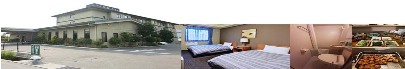
Hotel Route-Inn Court Azumino Toyoshina Ekiminami or Similar

ที่พัก ROUTE INN AZUMINO หรือเทียบเท่า (โรงแรมที่ระบุในรายการทัวร์เป็นเพียงโรงแรมที่นำเสนอเบื้องต้นเท่านั้น ซึ่งอาจมีการเปลี่ยนแปลง แต่โรงแรมที่เข้าพักจะเป็นโรงแรมระดับเทียบเท่ากัน)