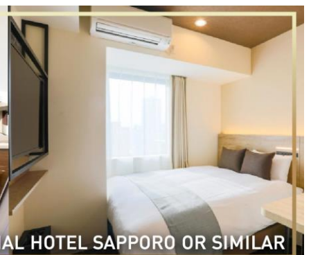
WING INTERNATIONAL HOTEL SAPPORO OR SIMILAR