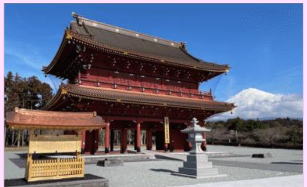
รูปใช้เพื่อประกอบการโฆษณาเท่านั้น