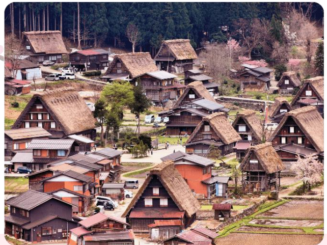
รูปใช้เพื่อประกอบการโฆษณาเท่านั้น

นำท่านเดินทางสู่ หมู่บ้านมรดกโลกชิราคาวาโกะ (Shirakawago) จังหวัดกิฟุ เมืองที่เป็นมรดกโลกทางวัฒนธรรมของประเทศญี่ปุ่น เป็นหมู่บ้านชาวนาที่มีรูปร่างแปลกตาติดอันดับ ซึ่งได้ชื่อว่าเป็น The most beautiful village in Japan และเป็นเมืองมรดกโลกที่มีชื่อเสียงแห่งหนึ่ง โดยมีบ้านทรงแบบ "กัสโซสิคุริ" เป็นบ้านชาวนาโบราณที่มีอายุมากกว่า 250 ปี คำว่า "กัสโซ" มีความหมายว่า "พนมมือ" ซึ่งเป็นการบ่งบอกถึงลักษณะรูปแบบของบ้านที่มีหลังคาบุงด้วยฟางข้าวที่ทำมุมชันถึง 60 องศา คล้ายสองมือที่ประนมเข้าหากัน