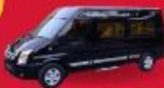
VAN (7-8 ท่าน)

สำหรับท่านที่ต้องการความเป็นส่วนตัวมากขึ้น ท่านสามารถเลือกใช้บริการ รถส่วนตัวได้ โดยมีรูปแบบรถให้เลือกถึง 2 ประเภท โดยรถ แต่ละประเภท สามารถนั่งได้ตั้งแต่ 2 ท่านขึ้นไป