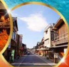
ถนนคนเดินฮิโระ