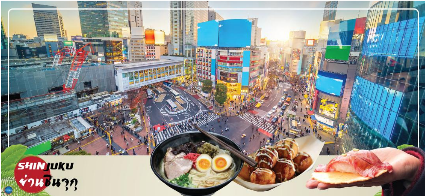
SHINJUKU ย่านชินจุกุ

นำท่านช้อปปิ้ง ย่านช้อปปิ้งชินจุกุ (Shinjuku) ให้ท่านอิสระและเพลิดเพลินกับการช้อปปิ้งสินค้ามากมายทั้งเครื่องใช้ไฟฟ้า กล้องถ่ายรูปดิจิทัล นาฬิกา เครื่องเล่นเกมส์ หรือสินค้าที่จะเอาใจคุณ ผู้หญิงด้วย กระเป๋า รองเท้า เสื้อผ้า แบรินด์เนม เสื้อผ้าแฟชั่นสำหรับวัยรุ่น เครื่องสำอางยี่ห้อดังของญี่ปุ่นไม่ว่าจะเป็น KOSE, KANEBO, SK II, SHISEDO และอื่นๆ อีกมากมาย ห้ามพลาด!!! จุดเช็คอินแห่งใหม่ของชาวโซเชียล นั่นก็คือ แมวยักษ์ 3 มิติ ที่โผล่บนจอแอลอีดีมีขนาดมหึมา จอมีความโค้งขนาด 154 ตารางเมตร (1,664 ตารางฟุต) เสียงที่ออกจากลำโพงคุณภาพเกรดดี ความละเอียดภาพระดับ 4K ถือเป็นเทคโนโลยีระดับสูง ที่ให้ภาพเสมือนจริงปรากฏเป็นภาพแมวเหมียวเดินเล่นไปมาอยู่เหนือกรุงโตเกียว นอกจากแมวยักษ์แล้ว ท่านยังสามารถรับชมโฆษณาต่างๆ ที่ถูกครีเอทให้เป็นภาพ 3 มิติผ่านจอแอลอีดีนี้ ไม่ว่าจะเป็น แพนด้า, รองเท้าไนกี้, น้องหมา Pompompurin, จานบิน UFO แม้แต่ หุ่นยนต์เครื่องดูดฝุ่น ท่านสามารถรับชมและเก็บภาพได้ตามอัธยาศัย