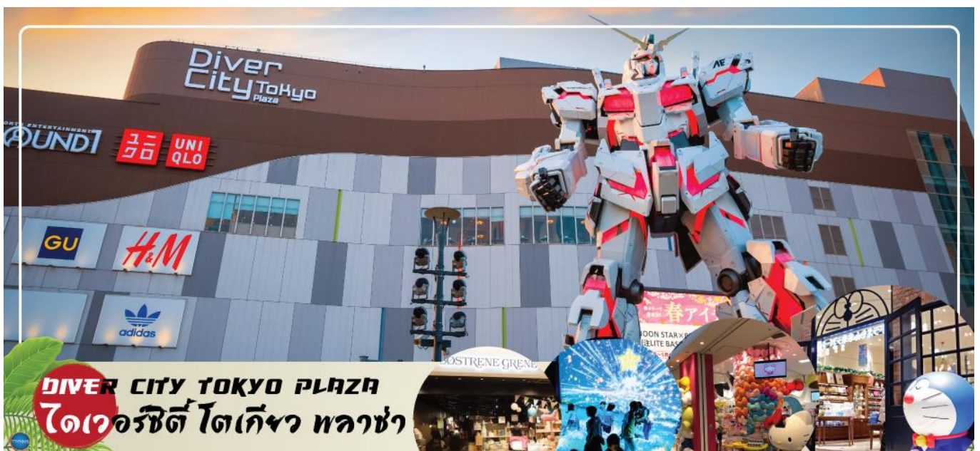
DIVER CITY TOKYO PLAZA ไดเวอร์ซิตี โตเกียว พลาซ่า

เดินทางสู่ ย่านโอไดบะ (Odaiba) (ใช้เวลาเดินทางประมาณ 40 นาที) คือเกาะที่สร้างขึ้นไว้เป็นแหล่งช้อปปิ้ง และแหล่งบันเทิงต่างๆ ในอ่าวโตเกียว ได้รับการปรับปรุงให้มีชื่อเสียงและเป็นที่ยอมรับ