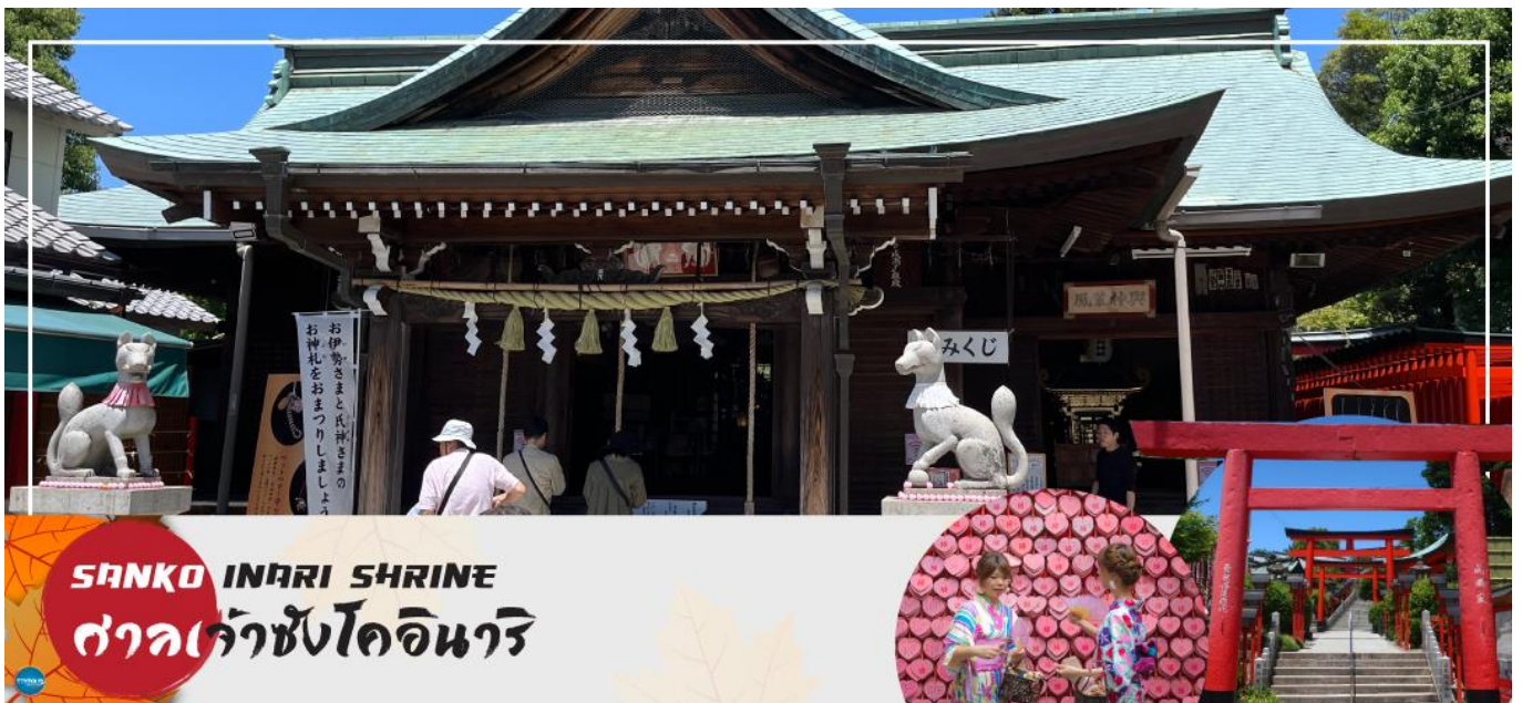
SANKO INARI SHRINE ศาลเจ้าซังโคอินาริ

จากนั้นนำท่านเดินทางสู่ ศาลเจ้าซังโคอินาริ (Sanko Inari Shrine) ตั้งอยู่ใกล้ๆ กับปราสาทอินยามะ ศาลเจ้านี้มีชื่อเสียงเรื่องความรัก คู่รักมักจะมาขอพรให้มีความสัมพันธ์ที่ดี ชีวิตคู่ราบรื่น ครอบครัวยาวนาน ส่วนคนโสดก็จะขอให้ได้พบเจอคู่แท้จุดเด่นคือเสาโทริอิสีแดงที่เรียงรายสวยงาม และแผ่นป้ายขอพรรูปหัวใจสีชมพู ที่นี้ยังช่วยเรื่องการเงินอีกด้วย ว่ากันว่าถ้านำเงินมาล้างที่บ่อน้ำศักดิ์สิทธิ์ภายในศาลเจ้า จะช่วยให้เงินนั้นงอกเงยขึ้นหลายเท่า ครอบครัวยุเจริญรุ่งเรือง