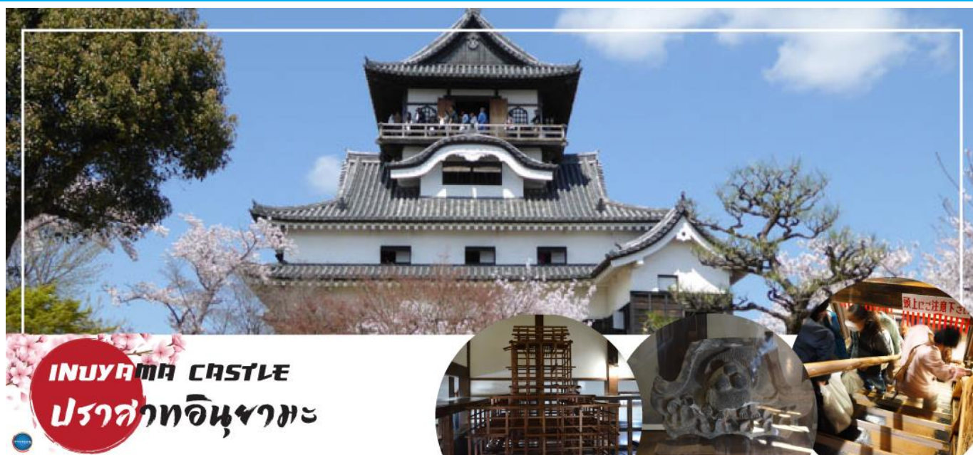
INUYAMA CASTLE ปราสาทอินูยามะ

00.45 น. เห็นฟ้าสู่ เมืองนาโกย่า ประเทศญี่ปุ่น โดยเที่ยวบินที่ XJ638