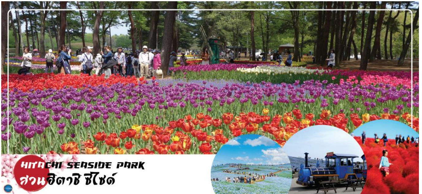
HITACHI SEASIDE PARK สวนฮิตาชิ ซีไซด์

วันที่สอง ท่าอากาศยานนานาชาตินาริตะ – เมืองอิบารากิ – สวนฮิตาชิ ซีไซด์(ช่วงดอกแดฟโฟดิล และ ทิวลิป)