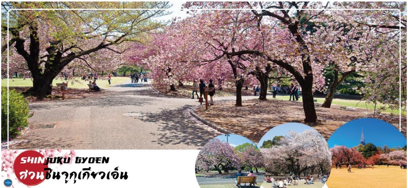
SHINJUKU GYOEN สวนชินจูกุเกียวเอ็น

เมืองนาริตะ – กรุงโตเกียว – สวนชินจูกุเกียวเอ็น (จุดชมซากุระขึ้นกับภูมิภาค) – ศาลเจ้าเมจิ – โทโยสุ เซนเคียวคุ บันไร – ย่านโอไดบะ – ห้างไดเวอร์ซิตี – เมืองนาริตะ