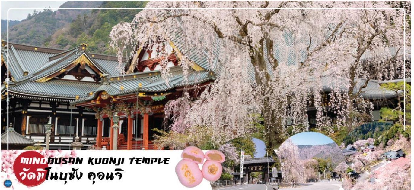
MINOBUSAN KUONJI TEMPLE วัดมิโนบุซัง คุอนจิ

กระเช้าไฟฟ้ามิโนบุซัง – จังหวัดชิซุโอกะ – นิสงไดระ ยูเมะ เทอร์เรซ – เมืองนาโกย่า – ย่านซาดาเอะ