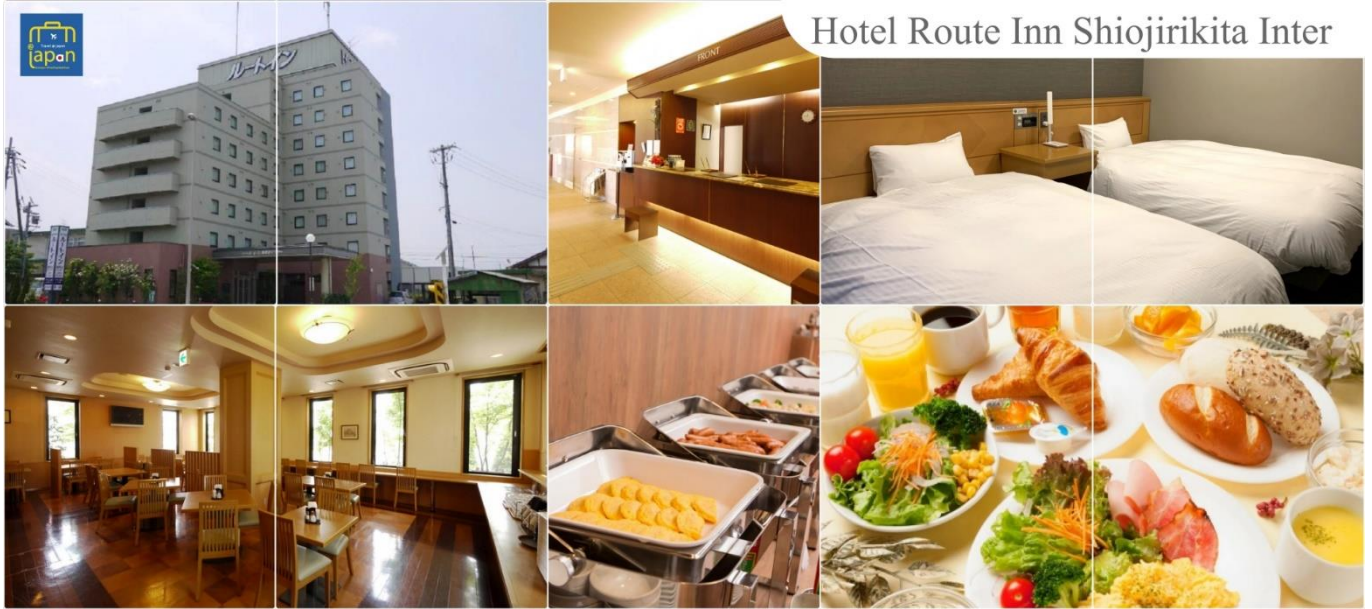
Hotel Route Inn Shiojirikita Inter

HOTEL ROUTE-INN SHIOJIRIKITA INTER, MATSUMOTO หรือเทียบเท่าระดับเดียวกัน (โรงแรมที่ระบุในรายการทัวร์เป็นเพียงโรงแรมที่น่าเสนอเบื้องต้นเท่านั้น ซึ่งอาจมีการเปลี่ยนแปลง แต่โรงแรมที่ เข้าพักจะเป็นโรงแรมระดับเทียบเท่ากัน)