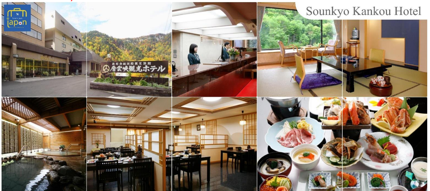
Sounkyo Kankou Hotel

หลังอาหารให้ท่านได้ผ่อนคลายกับการแช่น้ำแร่ธรรมชาติ เชื่อว่าถ้าได้แช่น้ำแร่แล้ว จะทำให้ผิวพรรณสวยงามและช่วยให้ระบบหมุนเวียนโลหิตดีขึ้น (โรงแรมที่ระบุในรายการทัวร์เป็นเพียงโรงแรมที่น่าเสนอเบื้องต้นเท่านั้น ซึ่งอาจมีการเปลี่ยนแปลง แต่โรงแรมที่เข้าพักจะเป็นโรงแรมระดับเทียบเท่ากัน)