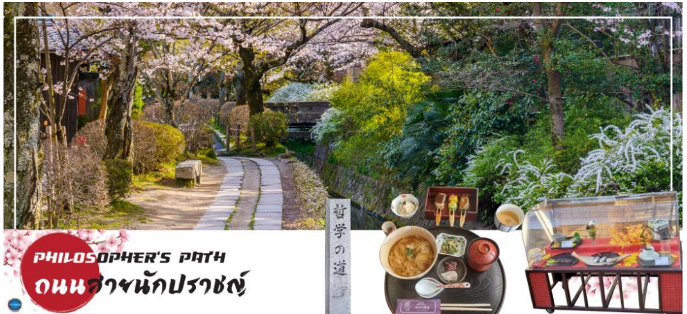
PHILOSOPHER'S PATH ถนนสายนักปราชญ์

บริเวณใกล้เคียงกันนำท่านเดินชม และช้อปปิ้ง ถนนสายนักปราชญ์ (Philosopher's Path) หรือ Tetsugaku no Michi เป็นถนนทางเดินเล็กๆ เลียบคลองส่งน้ำทะเลสาบบิวะ (Lake Biwa Canal (Biwako-sosui)) ตั้งอยู่ทางตะวันออกของเมืองเกียวโต (Kyoto) โดยเริ่มต้นตั้งแต่ใกล้ๆ กับวัดกินคะคุจิ (Ginkakuji Temple) ยาวมาจนถึงใกล้ๆ กับบริเวณวัดเอคันโด (Eikando Temple) และวัดนันเซ็นจิ (Nanzenji Temple) รวมเป็นระยะทางประมาณ 2 กิโลเมตร โดยตลอดเส้นทางนั้นก็เรียงรายไปด้วยต้นซากุระประมาณ 500 ต้น จึงเป็นจุดชมซากุระยอดนิยมในช่วงกลางเดือนมีนาคมถึงช่วงต้นเดือนเมษายน (ขึ้นอยู่กับภูมิอากาศ) และที่แห่งนี้ก็ยังมีร้านขายของและคาเฟ่น่ารักๆ กับน้องแมวที่อาจจะโผล่มาให้ท่านได้ถ่ายรูปอีกด้วย