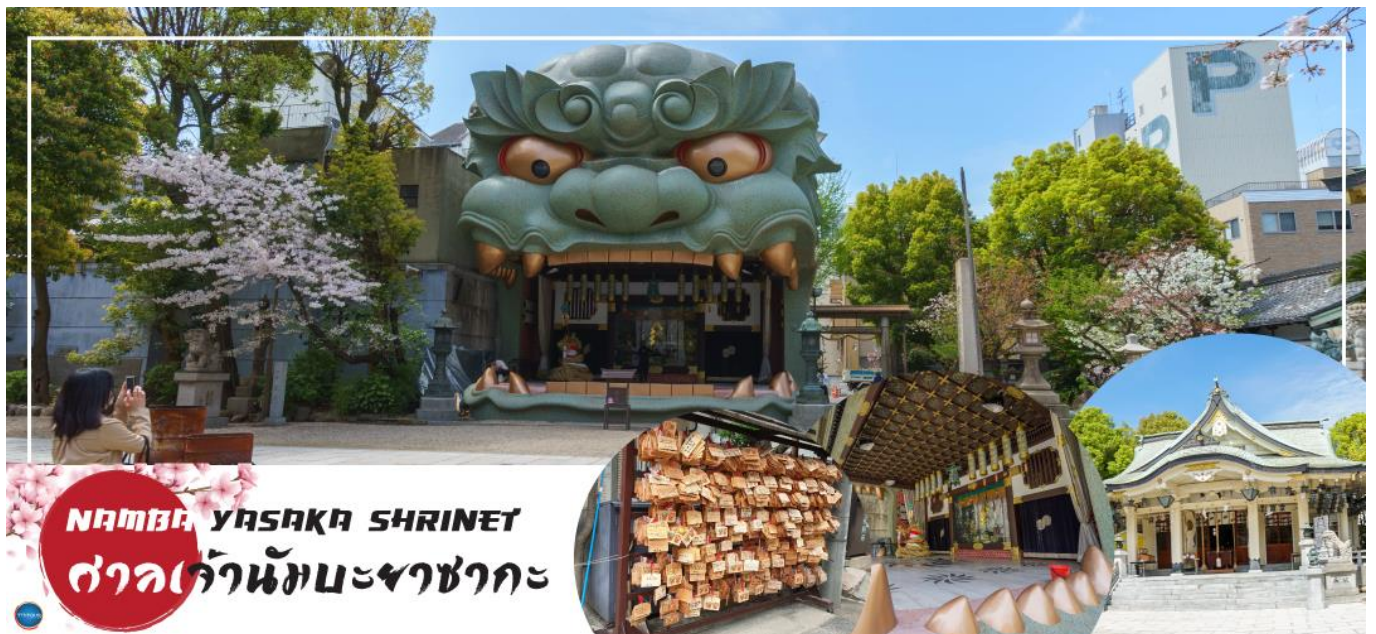
NAMBA YASAKA SHRINE ศาลเจ้านัมมะยาซากะ

เมืองโอซาก้า – ศาลเจ้านัมมะยาซากะ – ตลาดคุโรมง – ห้างออิออน มอลล์ ริงกุเซนน – ท่าอากาศยานนานาชาติคันไซ – ท่าอากาศยานนานาชาติดอนเมือง