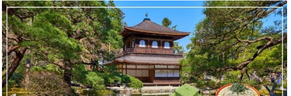
GINKAKUJI TEMPLE วัดกินคะคุจิ หรือ วัดเงิน

ทะเบียนกับองค์การยูเนสโกให้เป็นมรดกโลกด้านวัฒนธรรม ซึ่งวัดกินคะคุจิเป็นวัดนิกายเซน ถูกสร้างขึ้นโดยโชกุนอชิคากะ โยชิมาสะ หลานชายของท่านโชกุน ที่สร้างวัดกินคะคุจิ (Kinkakuji Temple) หรือ ที่รู้จักกันอย่างกว้างขวางว่าวัดทองสำหรับอาคารของวัดเงิน สร้างขึ้นในรูปแบบเดียวกัน เพียงแต่จะไม่ได้มีสีทอง เป็นอาคาร 2 ชั้น และมีกฟินิกซ์อยู่บนหลังคาอาคารเช่นเดียวกัน อาณาบริเวณของวัดซึ่งอยู่บนเขายังคงสภาพความเป็นธรรมชาติป่าอย่างสมบูรณ์แบบ มีต้นไม้ขนาดใหญ่ ในแบบสวนญี่ปุ่น เต็มไปด้วยความชุ่มชื้นเย็นสบาย