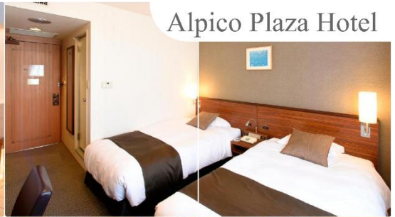
Alpico Plaza Hotel