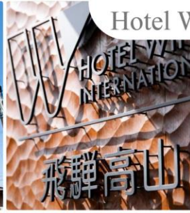
Hotel Wing International Hida Takayama