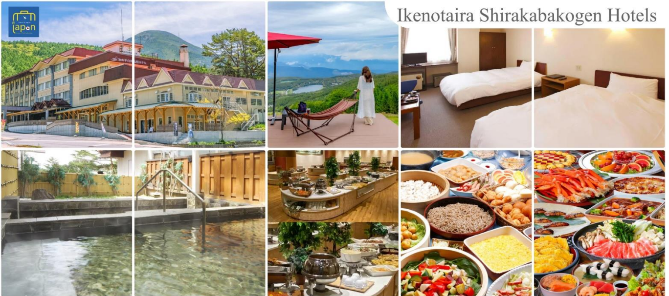
Ikenotaira Shirakabakogen Hotels

รับประทานอาหารเช้า ณ ภัตตาคาร ของโรงแรม (4) หลังอาหารให้ท่านได้ผ่อนคลายกับการแช่น้ำแร่ธรรมชาติ เชื่อว่าถ้าได้แช่น้ำแร่แล้ว จะทำให้ผิวพรรณสวยงามและช่วยให้ระบบหมุนเวียนโลหิตดีขึ้น