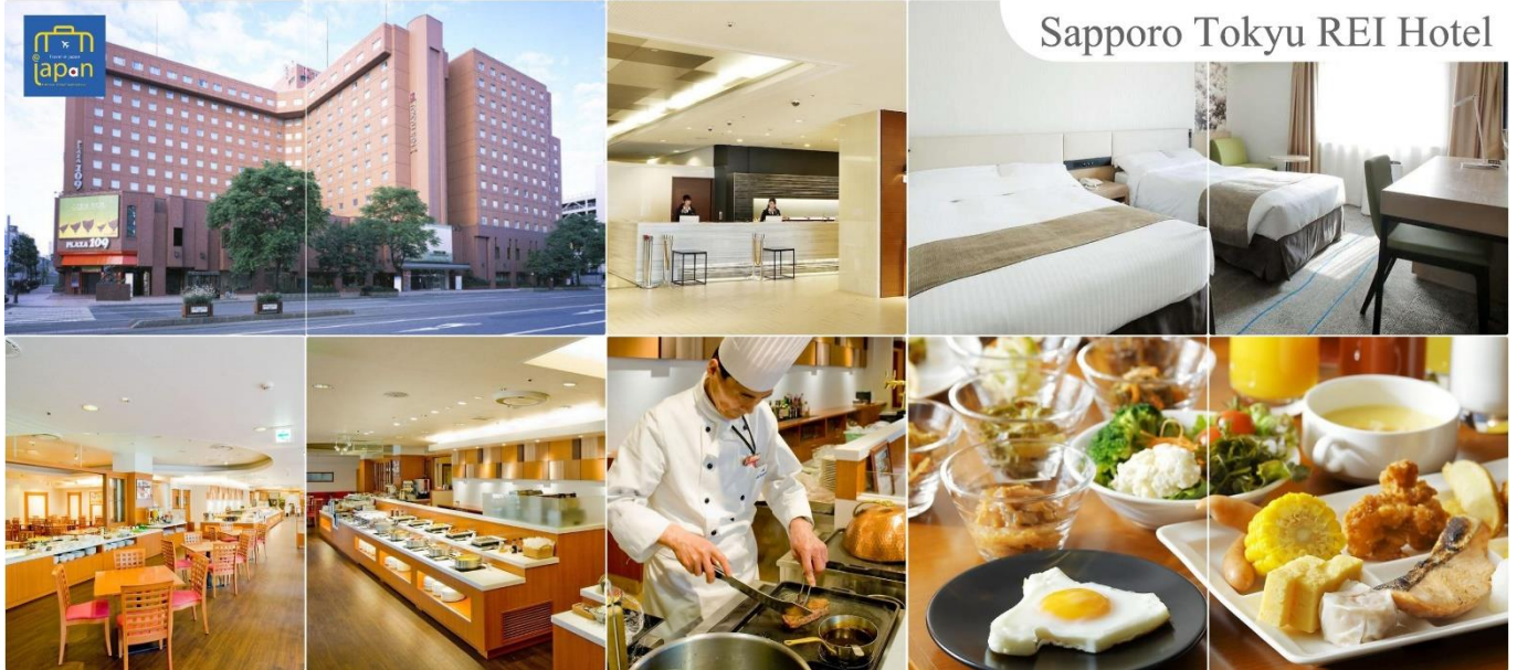
Sapporo Tokyu REI Hotel

SAPPORO TOKYU REI HOTEL หรือเทียบเท่าระดับเดียวกัน (โรงแรมที่ระบุในรายการทัวร์ เป็นเพียงโรงแรมที่นำเสนอเบื้องต้นเท่านั้น ซึ่งอาจมีการเปลี่ยนแปลง แต่โรงแรมที่เข้าพักจะเป็นโรงแรมระดับเทียบเท่ากัน)