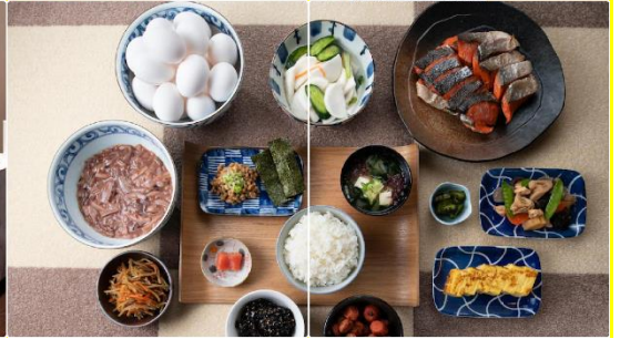
Hotel Mystays Hakodate Goryokaku

วันที่สาม ตลาดเช้าฮาโกดาเตะ – โกดังอิฐแดง – ย่านเมืองเก่าโมโตมาชิ – ป้อมโกเรียวคาคุ (เข้าชม) – ทะเลสาบโทยะ – ออนเซน