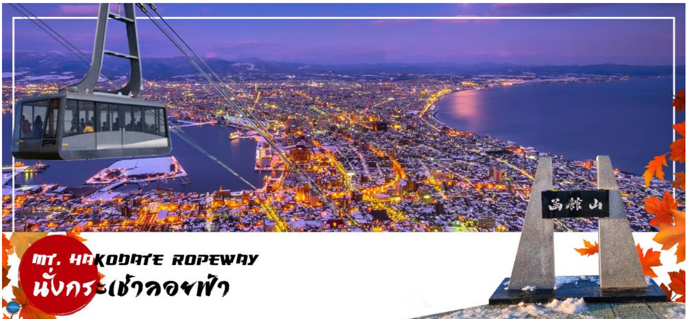
MT. HAKODATE ROPEWAY นั่งกระเช้ามองฟ้า

นำท่านนั่ง กระเช้าชมวิวกองกลางคืน ณ ภูเขาฮาโกดาเตะ (Mount Hakodate) สูง 334 เมตร ตั้งอยู่ในป่าทางตอนใต้ของปลายคาบสมุทรใกล้ใจกลางเมืองฮาโกดาเตะ ในวันที่ท้องฟ้าโปร่งทั้งกลางวันและกลางคืน สามารถมองเห็นวิวทิวทัศน์ทั้งงดงาม ซึ่งเป็นวิวทิวทัศน์ทั้งงดงาม ติดอันดับ1ใน3ของญี่ปุ่น