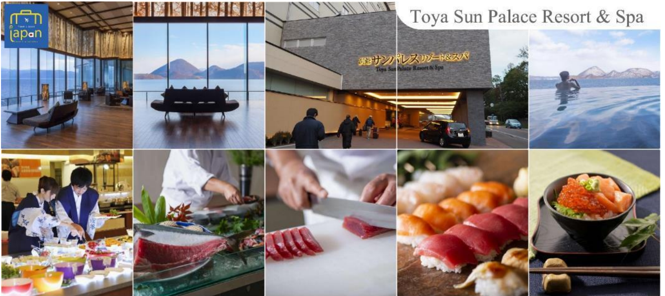
Toya Sun Palace Resort & Spa

วันที่สี่ ทะเลสาบโทยะ – ภูเขาไฟโซวะ (นั่งกระเช้า) – ศูนย์อนุรักษ์พันธุ์หมีสีน้ำตาล – สวนฟูกิดาชิ – เมืองซัปโปโร – ย่านชูซุกิโนะ