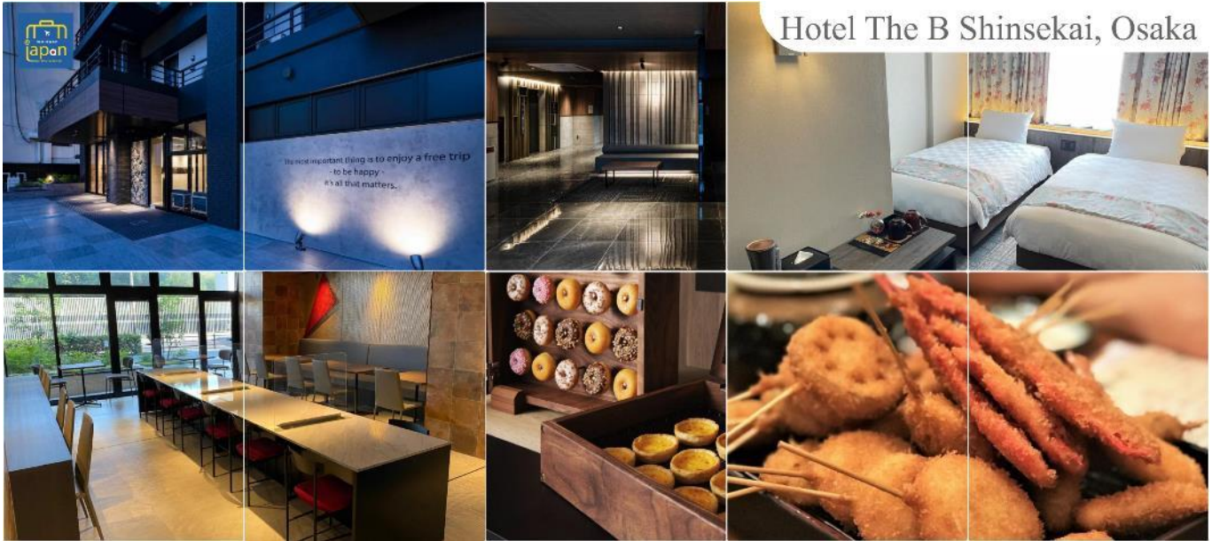
Hotel The B Shinsekai, Osaka

วันที่ห้า เมืองโอซาก้า – ปราสาทโอซาก้า(ด้านนอก) – ตลาดคุโรมง – ศาลเจ้านัมมะงะซากะ – ช้อปปิ้งชินไซบาชิ