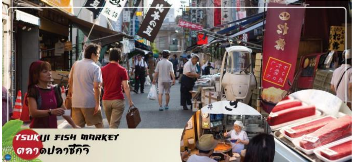
TSUKIJI FISH MARKET ตลาดปลาซึกิจิ

จากนั้นนำท่านสู่ ตลาดปลาซึกิจิ (ใช้เวลาเดินทางประมาณ 1 ชั่วโมง) ตลาดสดเก่าแก่แห่งหนึ่งของจังหวัดโตเกียว มีของอร่อยมากมายหลากหลายให้ท่านได้เลือกซื้อและชิมความอร่อยกันอย่างจุใจ ภายในตลาดปลา มีร้านทั้งร้านซูชิ แลปลาสดๆ ทั้งปลาทูน่า ปลาแซลมอน เป็นต้น ความอร่อยที่ไม่ควรพลาดอีกมากมายเช่น ไชหวานย่างชื่อดัง ข้าวหน้าปลาไหล ก๋วยเตี๋ยวเนื้อตุ๋นรสเด็ด ฯลฯ รวมถึงผลไม้ที่ท่านสามารถเลือกซื้อกลับบ้านได้อีกด้วย