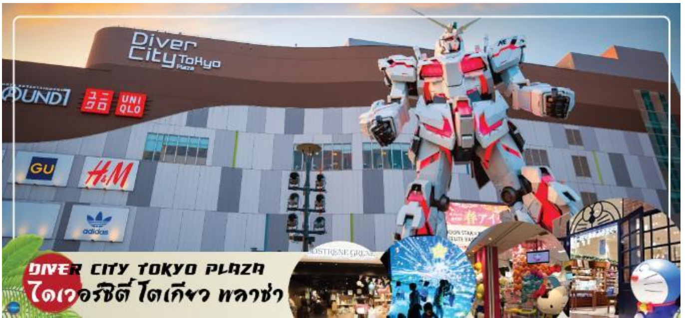
เย็น อิสระรับประทานอาหารเป็นตามอัธยาศัย

จากนั้นเดินทางสู่ ย่านโอไดบะ (Odaiba) (ใช้เวลาเดินทางโดยประมาณ 30 นาที) เมืองคือเกาะที่สร้างขึ้นไว้เป็นแหล่งช้อปปิ้ง และแหล่งบันเทิงต่างๆ ในอ่าวโตเกียว ได้รับการปรับปรุงให้มีชื่อเสียง และเป็นที่ยอมรับในช่วงหลังของปี 1990 นอกจากมีสถาปัตยกรรมที่สวยงามตั้งอยู่มากมายแล้ว แต่ก็ยังคงความเป็นธรรมชาติไว้ด้วยความอุดมสมบูรณ์ของพื้นที่สีเขียว ไดเวอร์ซิตี โตเกียว พลาซ่า (Diver City Tokyo Plaza) เป็นห้างดังอีกห้างหนึ่ง ที่อยู่บนเกาะ โอไดบะ จุดเด่นของห้างนี้ก็คือ หุ่นยนต์กันดั้ม ขนาดเท่าของจริง ซึ่งมีขนาดใหญ่มาก ในบริเวณห้าง อิสระช้อปปิ้งตามอัธยาศัย