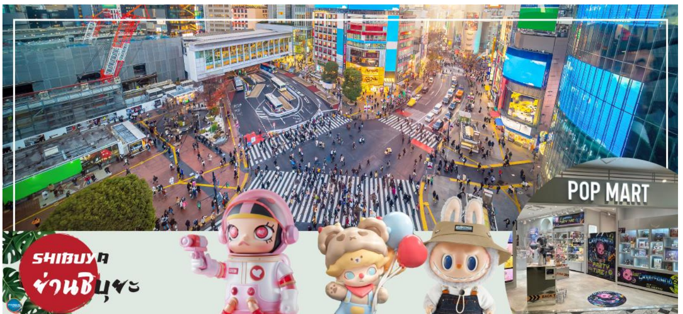
SHIBUYUKU ย่านชิบูยะ

นำท่านสู่ ย่านชินจูกุ (ใช้เวลาเดินทางประมาณ 40 นาที) แหล่งท่องเที่ยวและย่านที่ฮิตที่สุดแห่งหนึ่งของมหานครโตเกียว ที่นี่เป็นศูนย์กลางในการรวมตัวของวัยรุ่นและวัยทำงาน เพราะเป็นที่ตั้งของห้างสรรพสินค้า และแฟชั่นต่างๆ มากมาย โดยย่านชินจูกุนั้นมีศูนย์กลางอยู่ตรงสถานีรถไฟชินจูกุ หนึ่งในสถานีใหญ่ของโตเกียวที่มีความซับซ้อน เพราะมีรถไฟทั้งบนดินและใต้ดินหลายสาย จึงทำให้สถานีชินจูกุมีผู้คนผ่านไปมาถึงวันละประมาณ 2 ล้านคนๆ ที่สำคัญชินจูกุมีจุดนัดพบที่มีชื่อเสียงนั่นก็คือบริเวณอนุสรณ์รูปปั้นของสุนัขชื่อฮาจิโกะนั่นเอง และสายอาร์ตทอยต้องไม่พลาด!! POP Mart ที่เป็นที่นิยมในปัจจุบัน ซึ่งมีถึง 3 สาขาในบริเวณนี้ให้ท่านได้เลือกจุ่มกันอย่างตื่นตาตื่นใจ