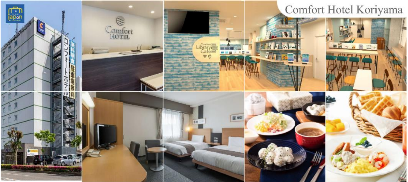
Comfort Hotel Koriyama