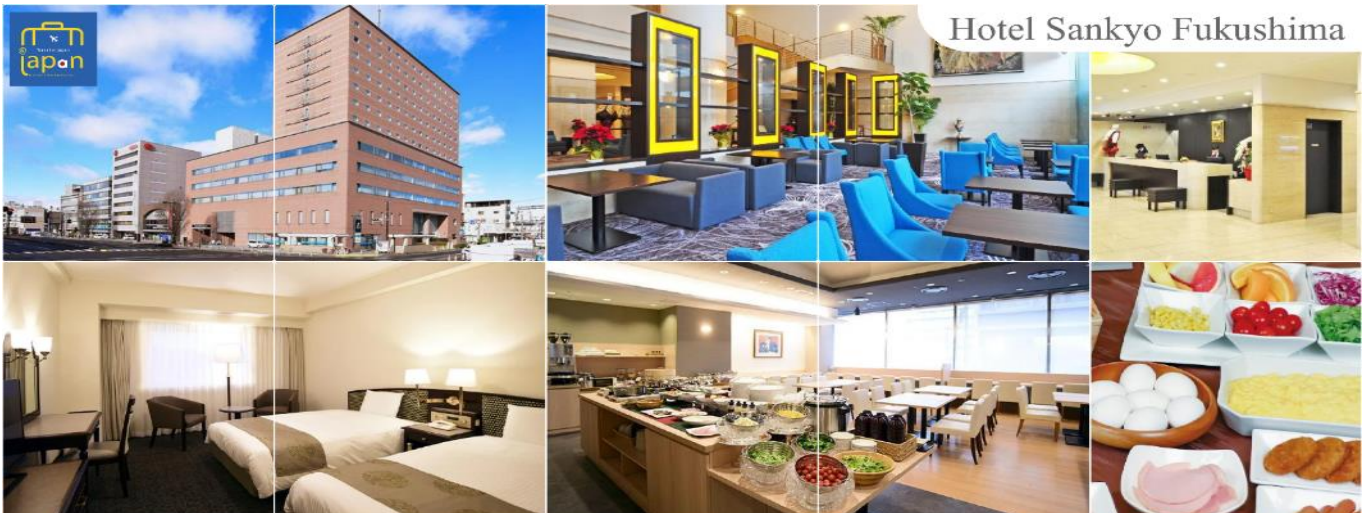
Hotel Sankyo Fukushima

HOTEL SANKYO FUKUSHIMA หรือเทียบเท่าระดับเดียวกัน (โรงแรมที่ระบุในรายการทัวร์ เป็นเพียงโรงแรมที่น่าเสนอเบื้องต้นเท่านั้น ซึ่งอาจมีการเปลี่ยนแปลง แต่โรงแรมที่เข้าพักจะเป็นโรงแรมระดับเทียบเท่ากัน)