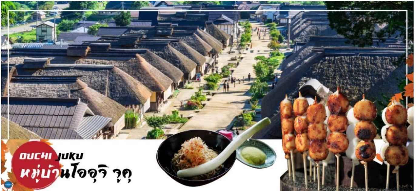
OUCHI JUKU หมู่บ้านโอบุจิ จุด

บริเวณใกล้เคียงกันนำท่านสู่ สถานีรถไฟยูโนคามิ ออนเซ็น (Yunokami Onsen Station) (ใช้เวลาเดินทางประมาณ 10 นาที) โดยเป็นสถานีรถไฟเพียงแห่งเดียวของญี่ปุ่นที่มีอาคารสถานีทำจากหลังคาแบบญี่ปุ่นโบราณ !!!ไฮไลท์ อิสระให้ท่านเพลิดเพลินกับการแช่เท้าผ่อนคลายตามอัธยาศัย ณ จุดออนเซ็นเท้าที่สถานีแห่งนี้