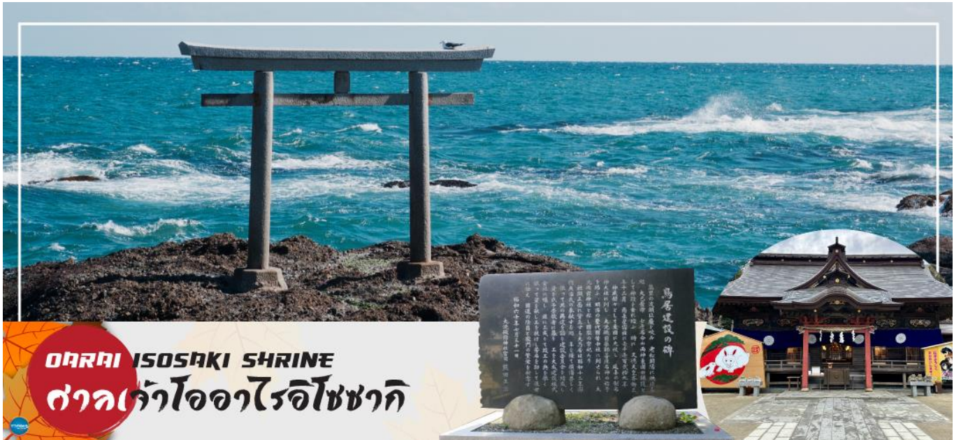
ORAI ISOSAKI SHRINE ศาลเจ้าโออาริอิโซซากิ

เดินทางสู่ ศาลเจ้าโออาริอิโซซากิ (Oarai Isosaki Shrine) ศาลเจ้าที่มีประวัติศาสตร์ยาวนาน ตั้งอยู่บนเนินเขาหันหน้าสู่มหาสมุทรแปซิฟิก เป็นหนึ่งในเสาโทริอิขนาดใหญ่ที่มีชื่อเสียงในภูมิภาคคันโต ถูกเลือกให้เป็นทรัพย์สินทางวัฒนธรรมแห่งจังหวัด และได้รับความเชื่อถือมาอย่างยาวนานในฐานะเทพเจ้าผู้ให้ความคุ้มครองการคมนาคมทางทะเล และความสงบสุขภายในครอบครัว นำท่านรับพลังงานบวก ณ เสาโทริอิแห่งคามิอิโซะ (Kamiiso no Torii) โทริอิสี่เสาที่นิ่งสงบ บนโขดหินท่ามกลางฟองคลื่นสีขาวที่สาดกระเซ็น ซึ่งเป็นที่ประดิษฐานของเทพเจ้าโอนามุจิโนะมิโคโตะ และเทพเจ้าสุคะเนอิโคเนะโนะมิโคโตะ สร้างขึ้นตั้งแต่ 29 ธันวาคม ค.ศ.856 รวมทั้งยังเป็นจุดถ่ายรูปพระอาทิตย์ขึ้นที่มีชื่อเสียง มีนักท่องเที่ยวมากมายมาเฝ้าคอยเพื่อเก็บภาพช่วงเวลาที่สวยงามที่แสงตะวันสาดส่องขึ้นสู่ขอบฟ้า