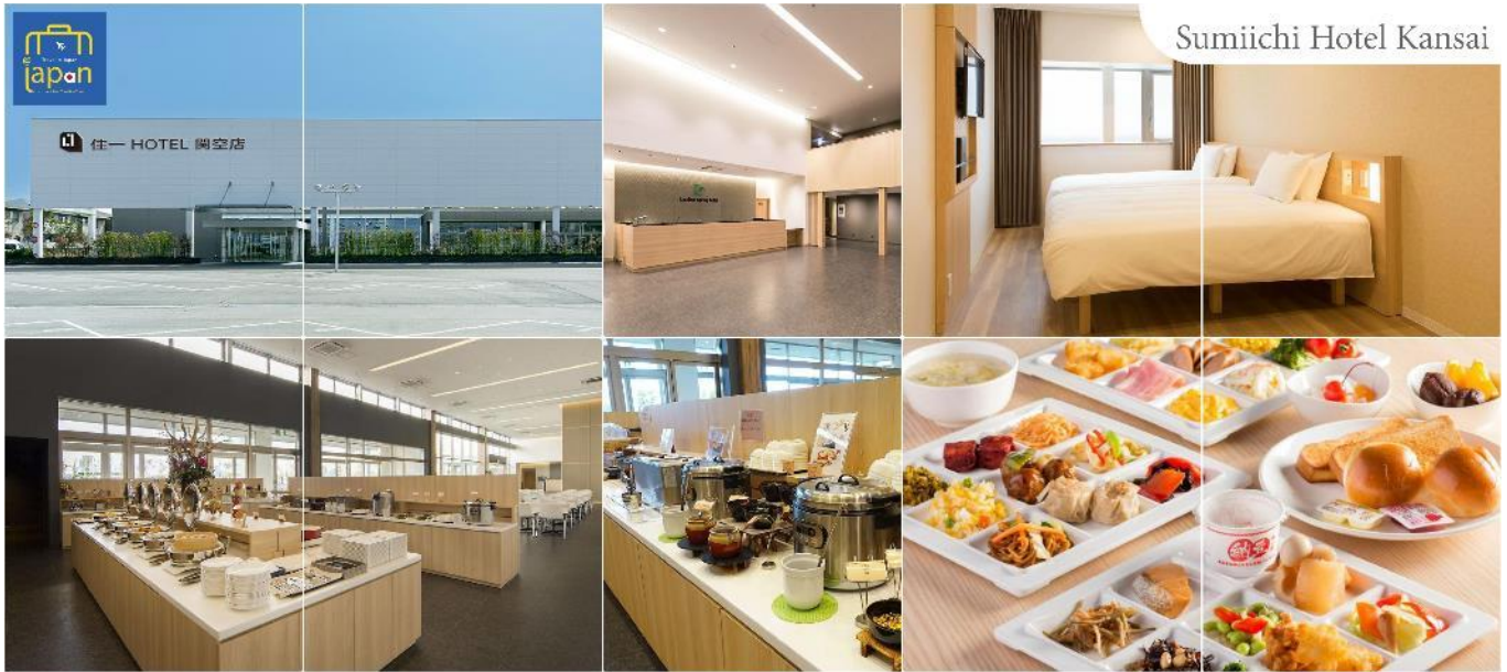
Sumiichi Hotel Kansai

วันที่สอง เมืองนารา – วัดโทไดจิ – สวนกวางนารา – เมืองโอซาก้า – ศาลเจ้าสมิโยชิ ไทละ – ศาลเจ้านัมมะยาซากะ – ช้อปปิ้งชินไซบาชิ