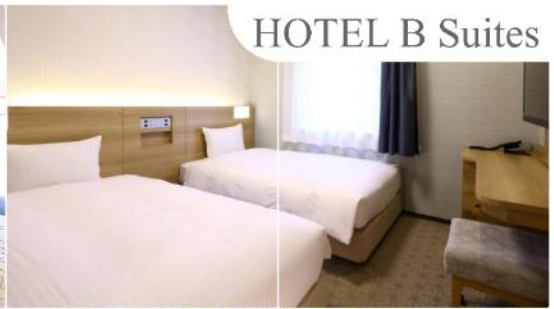
HOTEL B Suites