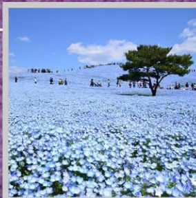
"HITACHI SEASIDE PARK"