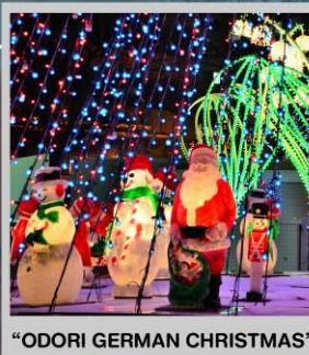
"ODORI GERMAN CHRISTMAS"