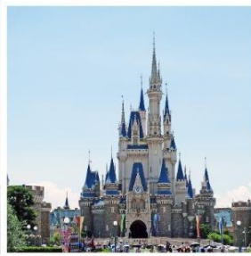
โตเกียว ดิสนีย์แลนด์