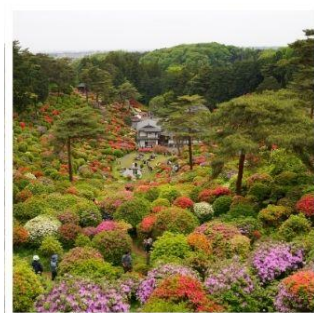
วัดชิโอะฟูเนะ คันนงจิ

โตเกียวดิสนีย์แลนด์ ดินแดนในฝันของคนทั้งโลก ฮานาโมโมะ โนะ ซาโตะ ดอกท้อกลางหุบเขาที่รอคุณมาเยือน ทางรถไฟสายเก่า เคอะเกะ อินโคลน์ 1 ในจุดชมซากุระที่สวยงามแห่งเกียวโต ขึ้นกระเช้าที่สูงที่สุดในญี่ปุ่น โคมากะทาเคะ กับแอ่งเทือกเขาสุดอัศจรรย์เขินโจจิกิ เซอร์ก ปราสาทอินุยามะ 1 ใน 12 ปราสาทดั้งเดิมกับทิวทัศน์อันแสนสวยงาม ชิโอะฟูเนะ คันนงจิ วัดแห่งดอกไม้สุด ntheek ที่ไม่ควรพลาด พักออนเซ็น 2 คัน!!! // อาหารพิเศษ...บุฟเฟ่ต์บึงย่าง, บุฟเฟ่ต์ชาบู, บุฟเฟ่ต์ซาบู กรุ๊ปสบายๆ เพียง 20 ท่านเท่านั้น!!!