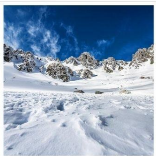
กระเช้าลอยฟ้าโคมากะทาเคะ