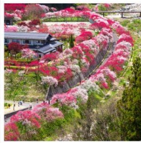
สวนฮานาโมโมะ โนะ ซาโตะ