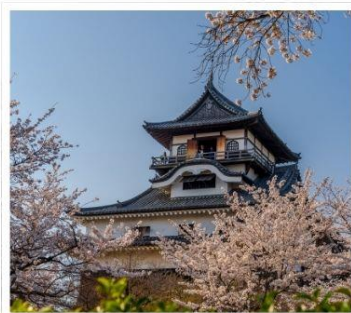
ปราสาทอินุยามะ