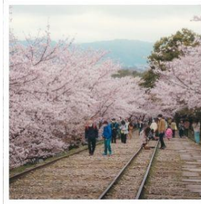
เคอะเกะ อินโคลน์