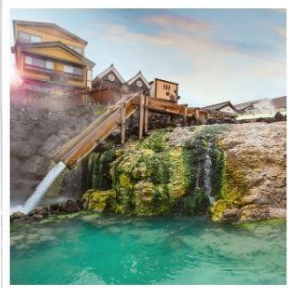
เมืองคุซัทสึ ออนเซ็น