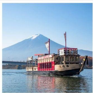
ล่องเรืออูปปะระะ