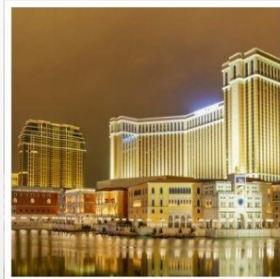
เดอะเวเนเชียน

ห้ามพลาดกับเมืองออนเซ็นแสนทรงเสน่ห์ คุซัทสึ สักการะ พระใหญ่ไดบุทสึ แห่งเมืองคามาคูระ สัมผัสประสบการณ์สุดพิเศษบนเทือกเขา เจแปนแอลป์ ปรับเปลี่ยนอริยาบท ล่องเรือญี่ปุ่นโบราณ ชมฟูจิอย่างเพลิดเพลิน กราบไหว้ขอพรกับ เทพเจ้าองค์ไท่ส่วยเจี๋ย วัดฟากง สัมผัสความอลังการของ เดอะเวเนเชียน รีสอร์ทระดับเวิลด์คลาส ชมแสงสี เมืองลาสเวกัสแห่งซีกโลกตะวันออก "มาเก๊า" พักออนเซ็น 2 คืน!!! // อาหาร : บุฟเฟต์ซาบู, บุฟเฟต์ปิ้งย่าง กรุ๊ปสบายๆ เพียง 25 ท่านเท่านั้น!!!