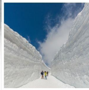
กำแพงหิมะ เจแปนแอลป์