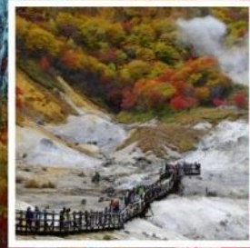
หุบเขารอกิจิโกะคุดานิ