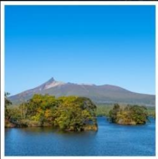
อุทยานแห่งชาติโอนูมะ