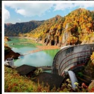
สันเขื่อนโอเฮเคียว