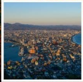
กระเช้าภูเขาฮาโกดาเตะ