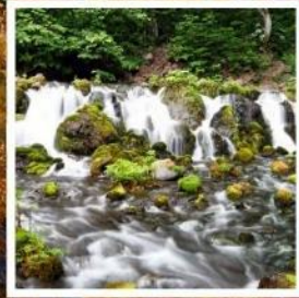
สวนฟูกิดาชิพาร์ค