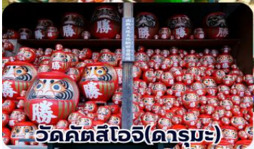
วัดคัตสึโอจิ(ดาร์มะ)