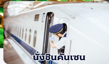
นั่งชินคันเซน