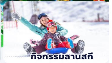
กิจกรรมลานสกี