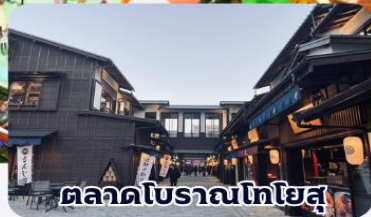
ตลาดโบราณโตโยสุ