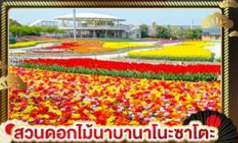
สวนดอกไม้บานานาโนะซาโตะ