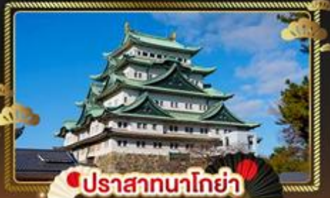
ปราสาทนาโกย่า