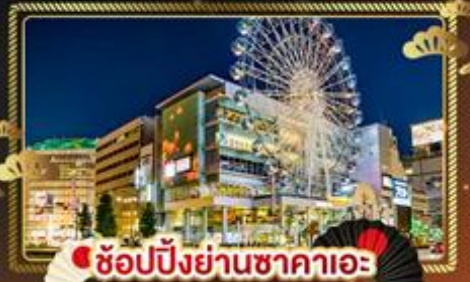
ช้อปปิ้งย่านซาคาเอะ