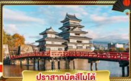
ปราสาทมัตสึโมโต้