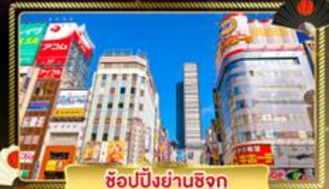
ช้อปปิ้งย่านซึกุ