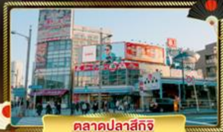
ตลาดปลาซึกิจิ