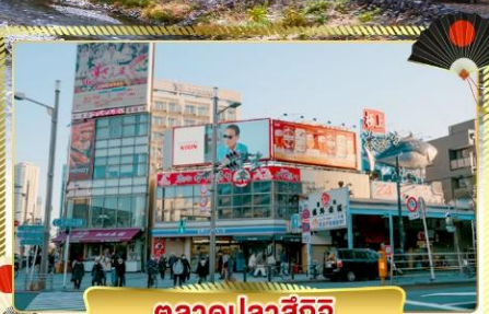
ตลาดปลาชิกิ