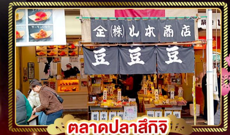
ตลาดปลาสึกิ