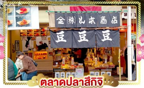
ตลาดปลาชิกิ