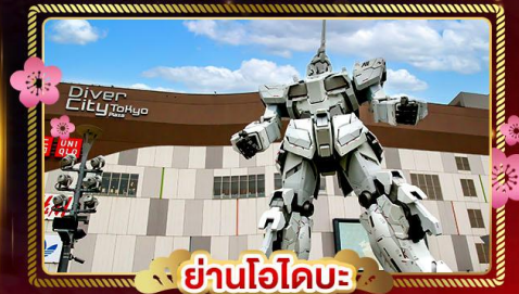
ย่านโอโดะ