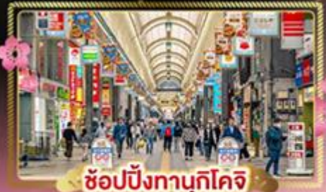
ช้อปปิ้งทานุกิโจจิ