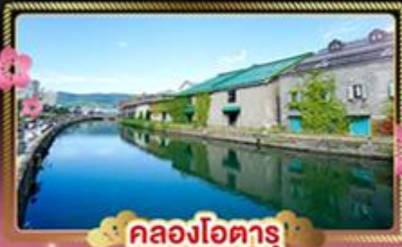
คลองโอตารุ