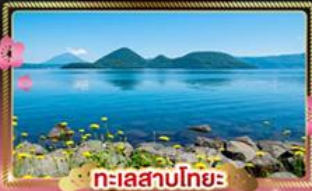
ทะเลสาบโทยะ