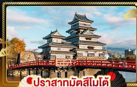
ปราสาทมัตสึโมโตะ