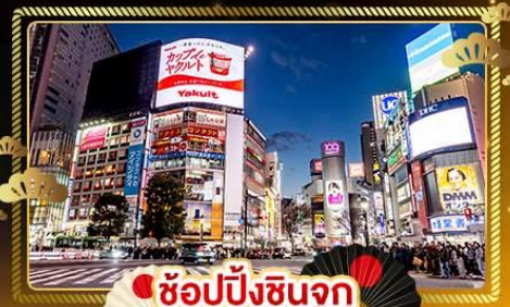
ช้อปปิ้งชินจูกุ