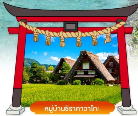
หมู่บ้านชิราคาวาโกะ