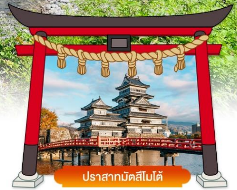
ปราสาทมัตสึโมโต้