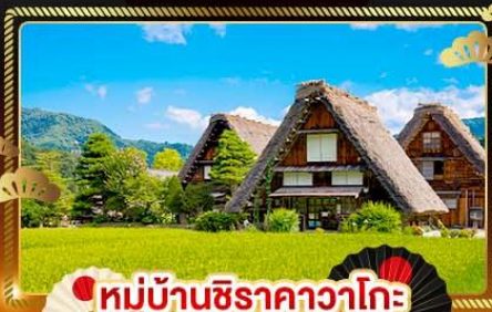
หมู่บ้านชิราคาวาโกะ

สุดยอดเส้นทางธรรมชาติของญี่ปุ่น "กำแพงหิมะเจแปนแอลป์"