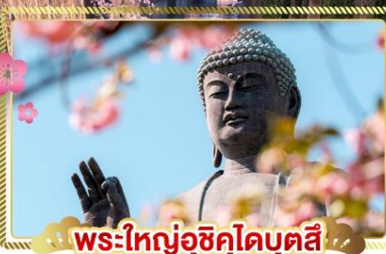
พระใหญ่อุซึคุโดบุตสึ