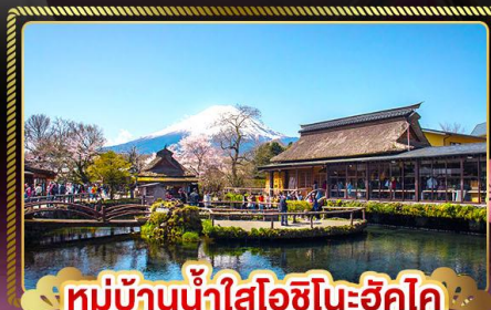
หมู่บ้านน้ำใสโอชิโนะฮัตสึ