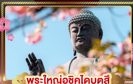
พระใหญ่อุซึคุโดบุตสึ