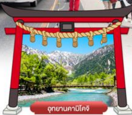
อุทยานคามิโคจิ