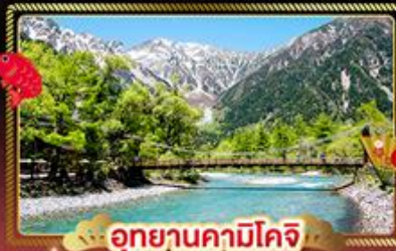
อุทยานคามิโคจิ