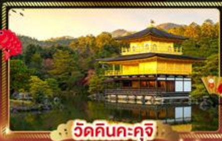
วัดคินคะคุจิ