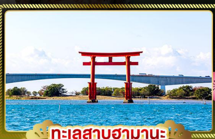
ทะเลสาบฮามานะ