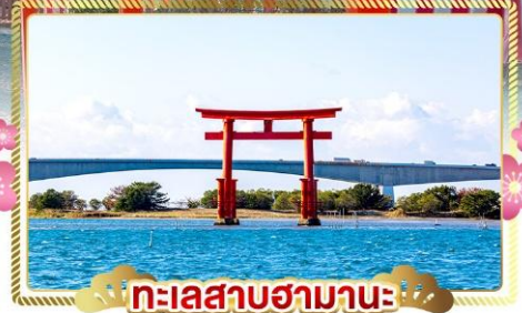
ทะเลสาบฮามานะ