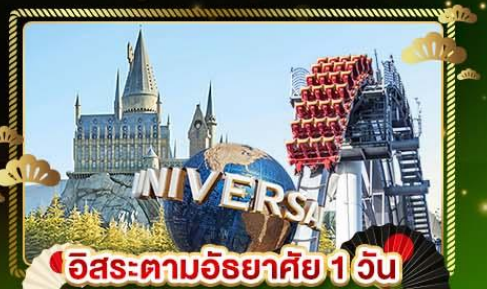
อิสระตามอริยาตย์ 1 วัน