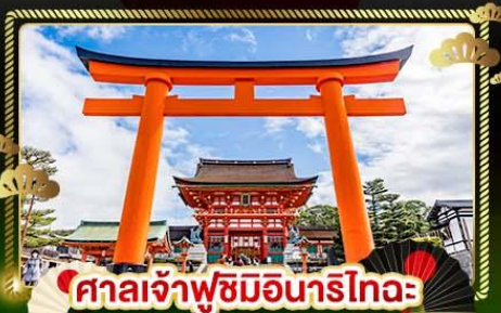
ศาลเจ้าฟูชิมิอินาริโทะ