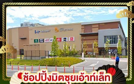
ช้อปปิ้งมิตรช้อปปิ้งเล็ก